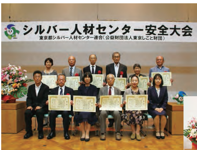
▲受賞者のみなさん