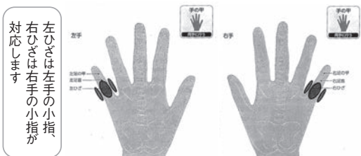
左ひざは左手の小指、右ひざは右手の小指が対応します

また、軽く押し込む際に、それに合わせて息を吐き出すようにするとより効果が上がります。