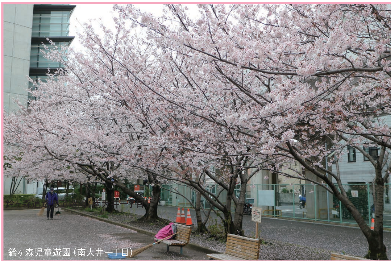
鈴ヶ森児童遊園 (南大井一丁目)

春に咲き誇る桜。区内にはいくつか名所がありますが、こちらは南大井にある鈴ヶ森道路児童遊園と大井水神公園の桜です。どちらもシルバー人材センターの会員が週2～3回清掃作業に従事しており、この季節は散り落ちた桜の花びらと格闘する毎日です。