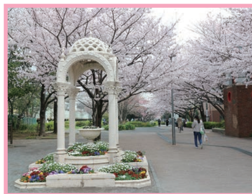
大井水神公園 (南大井五・六丁目)

この周辺には品川区民公園やしながわ花海道など、春は色とりどりの花々を鑑賞できるスポットが盛り沢山です。日頃の運動不足解消に桜の名所散歩に出かけてみてはいかがでしょうか？