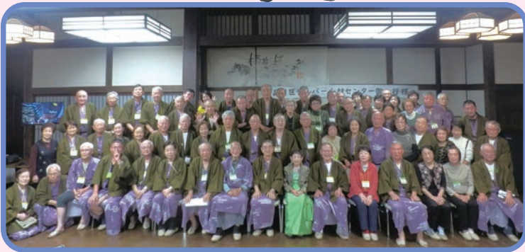
ホテルでの集合写真

翌2日目は、諏訪トコロテラス、諏訪大社上社本宮を訪れた後、おぎのや諏訪店で買い物をしてから、甲府近くの笹ご茶屋で昼食。最後は笹一酒造で試飲や買い物を楽しんで帰路に就きました。