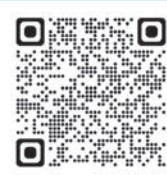
記念式典の動画配信

都内58センターが一堂に集結したTOKYOシルバー50周年フェスが10月23日（木）東京ドームシティ プリズムホールにて開催されました。都発祥の「シルバー人材センター」が昭和50年江戸川区に誕生してから、50周年となることをお祝いするとともに、次の50年に向けたセンターの役割や存在意義を広くPRするもので、品川区シルバー人材センターもブースを出し参加いたしました。記念式典では小池東京都知事もお祝いに駆け付け、品川区とも縁の深い落語家、桂宮治さんが記念講演を行い、代表センターの会員の方々がダンスやコーラスを披露する等終始大盛況でした。