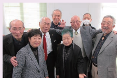
新年全体会後の一幕