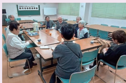
準備の合間にみんなでほっと一息