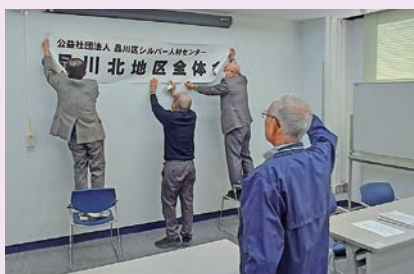
新年全体会の準備の様子

現在、各地区で地区委員の次世代の担い手が不足しています。お仕事以外にも余力があり、誰かの役に立つことに喜びを感じられる方などは適任です。品川区シルバー人材センターの縁の下の力持ちとして、是非あなたのお力を貸して下さい。ご興味がある方は地域の地区委員、お近くの事務所までお気軽にご連絡をお願いいたします。