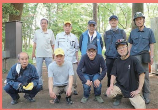
写真左の4名が目黒区・右の5名が品川区の会員

林試の森公園は明治33年に目黒試験苗圃としてスタートし、平成元年に現在の都立林試の森公園として開園しました。広い園内には林業試験場当時の樹木がそのまま残されており、都内とは思えないほど自然を感じる公園です。